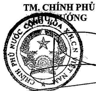
Nguyễn Tấn Dũng